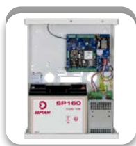
CENTRALES HARMONIA 3